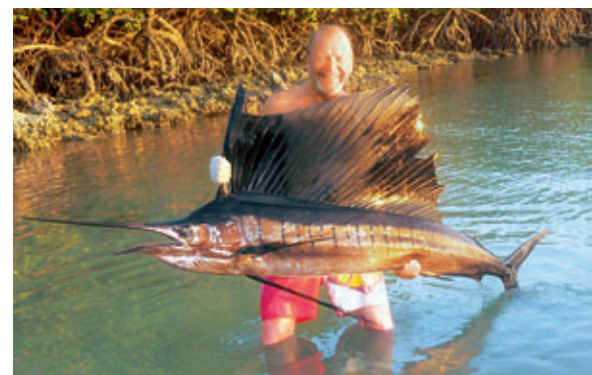
Autor mit «selbstgefangenem» Segelfisch.

«Schwachpunkt» Angler nicht durch Professionalität ausgleichen kann. Ich meine, dass es auch für diese «Lehnstuhlfischer» beschämend ist, wenn sie Fangfotos von Marlins vorzeigen, die sie nicht selber gehakt haben. Die weltweit gültigen Regeln der IGFA (International Game Fish Asso-