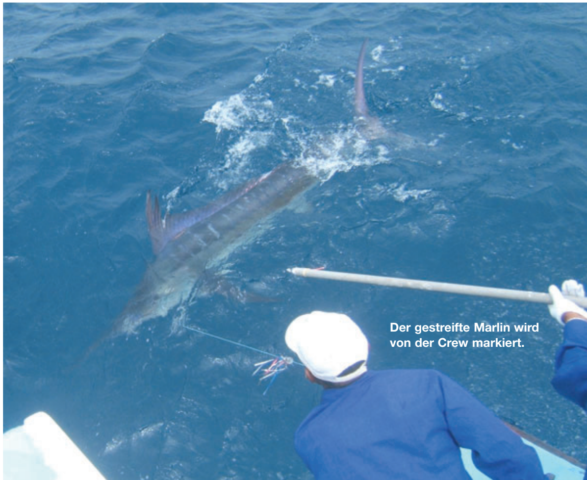
Der gestreifte Marlin wird von der Crew markiert.