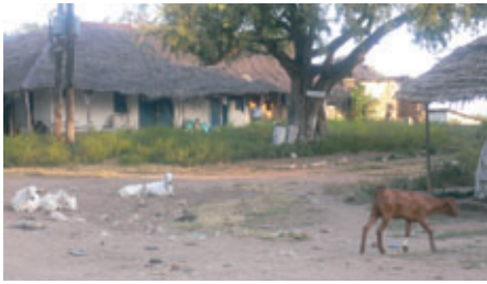
Das Dorf Shimoni an der Grenze zu Tansania blieb weitgehend verschont vom Massentourismus.

toren schaffte er drei Jahre in Folge die Auszeichnung als fängigstes Marlinboot.