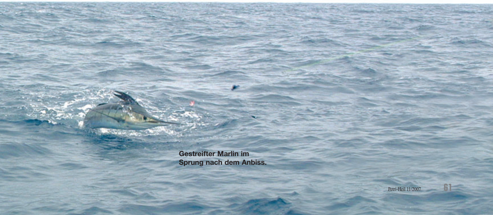
Gestreifter Marlin im Sprung nach dem Anbiss.